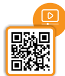
積金易使用指南及教學影片